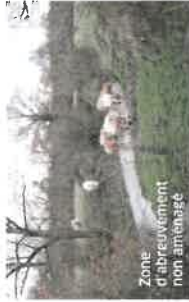
Zone d'abreuvement non aménagé