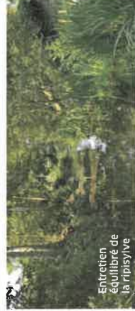
Entretien équilibré de la ripisylve