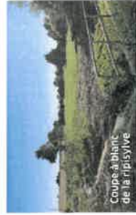
Coupe à blanc de la ripisylve