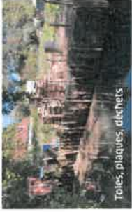
Toiles, plaques, déchets