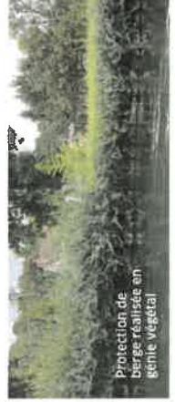
Protection de berge réalisée en genre végétal